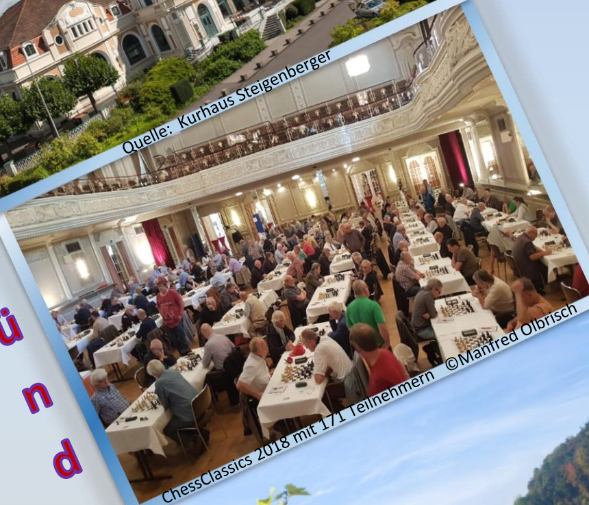
ChessClassics 2018 mit 171 Teilnehmern